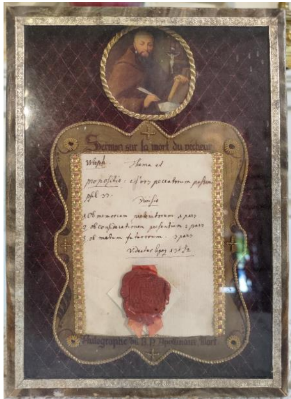
Plan manuscrit d'un sermon sur « la mort du pécheur » du bienheureux Apollinaire Morel conservé à la chapelle de Posat